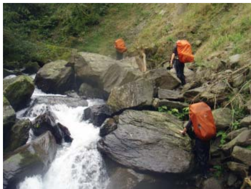
▲山上身體易濕，更得留意風寒效應。

假如是在乾爽的雪地，透氣不透水的特性絕對重要，因為汗排得出來，雪卻進不去。但在台灣的中級山或高山，下雨時相對溼度與飽和蒸汽壓常高到 80 % 到 100% 之間，汗水是排不太出來的！加上若常爬多荊棘的勘查路線，稍不小心就會鉤破，一旦刮壞或縫線貼布膠著老化，效果甚至可能比雨衣差。