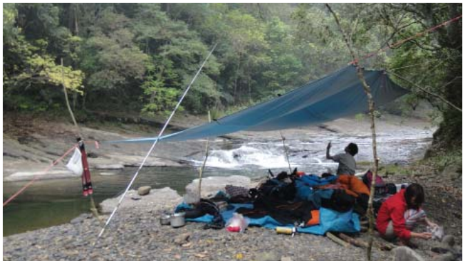
▲好營地應考量安全、平坦且有水有火。

上紮營，若無法下溪取水，一些草坡上的水池多是動物飲水所在，就算水質不佳，也常是求生必要的水源。或者，下雨時得利用外帳接水集水，煮開之後飲用。