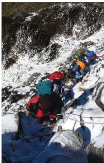
▲雪攀需要更好的保暖和抗風雪的防護層。

在台灣，大部分的登山衣著多可在成衣市場、傳統市場的百貨行、大賣場裡頭找得到，不一定要到百貨公司或「登山用品店」買（因為品牌而價差很大）。每件衣服依規定都應車上材質表，在排汗衣、保暖衣部分，只要認明每件衣服上的材質表是「聚酯纖維」（Polyester）的即可。切記：穿對衣服，再上山唷！