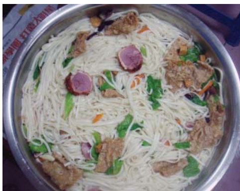
▲即使只是一鍋麵也應色香味與營養俱全！

「登山者永不言飽！」只要吃得飽，自然有體力，一切好說。在山上的吃，如果要有持續性的體力，吃飽很重要；如果不是要在山上一星期以上，只要主食足夠，營養縱使不夠均衡通常也無大礙，下山後很容易就補回來。