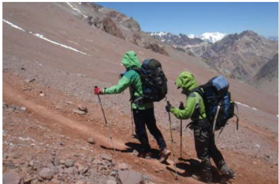
▲在裸露的岩屑地或雪地用雙杖比較省力。

最後要強調的是，登山通常是團體活動，因此團隊的協調與搭配良好與否，常會影響山野活動的行止。例如重量分擔，隊伍速度與距離掌控，需要進行安全確保時的協力互助等，都關係著隊伍的安全與舒適。要想快樂自在於山中行，領隊經驗與團隊默契相當重要，更得慎選隊伍！在此，祈願所有的愛山者，都能千里之行，始於足下；快快樂樂出門，平平安安下山。