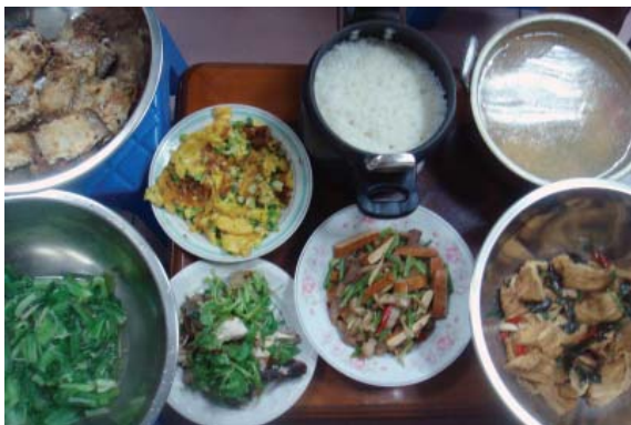
▲山上晚餐能六菜一湯實在是莫大享受。

多日的登山活動，背負大背包爬上又爬下，體力喪失很快，登山的體能消耗遠大於平日的的生活。平常吃一餐的熱量，在山野活動時不一定夠用；有時，背重裝走一兩個鐘頭，肚子就餓了。此時，我們