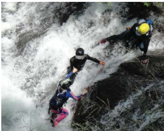
▲山野裝備得依活動目的和行程來選用。

登山之所以不只是體育運動，而應視為廣義的戶外活動的一環，最主要是因為「沒有任何一項體育運動需要如登山這般多的裝備」，才能確保安全無虞。但是對不熟悉登山裝備的人，一進入登山用品店一定被琳琅滿目、絢麗繽紛器材搞得眼花撩亂。因此得把登山裝備分類，才利於建立「登山裝備」的知識系統。