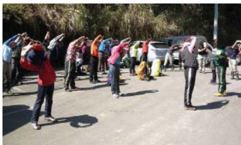
▲暖身操可避免體訓或登山時的運動傷害。

當然，如同一位有在登山的醫師所說：「登山，是最好的登山訓練！」任何山下的體能訓練，都無法完全替代登山本身。真正要提昇登山的體能，最好的方式還是經常上山，踏實穩健地走好每一步，久了之後，身體習慣在山野中的律動狀態，自然走得輕盈、順暢。