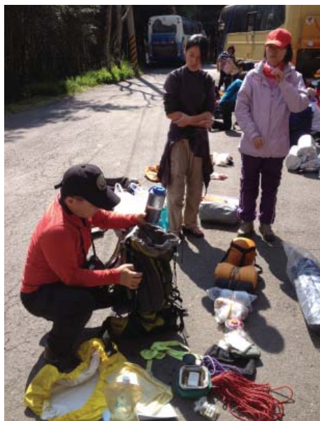
▲重心正確的打包會讓背包背起來更舒適。

選擇背包，以貼身舒適、適合自己身長為要。通常若是背包選購與調整得不差，重心是不會有太大的偏差，我們的身體會自然找尋到平衡的角度。而打理背包時，通常依循「上重下輕、內（貼近背部）重外輕、