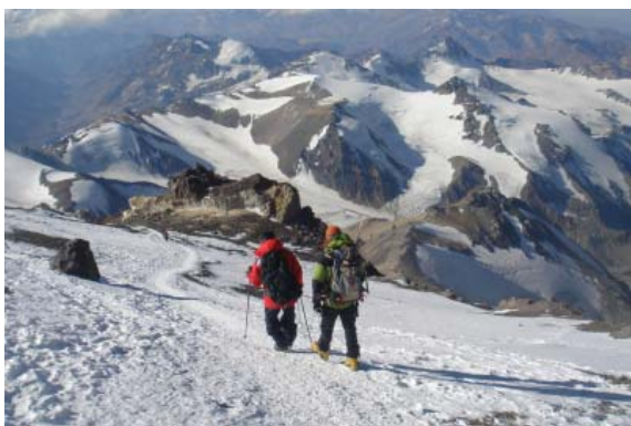
▲冰雪地攀登促進了登山裝備的演進。