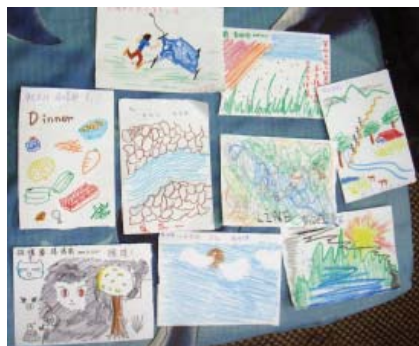
▲行前會議也可用圖繪方式召喚出參與者的內在聲音。

最後，隊伍出發前最好能落實「隊伍審查」與「山難留守」制度，讓有經驗與熟悉該山區者，審查該隊的行程設計、隊伍結構、團體裝備、個人裝備、糧食計畫、風險評估與緊急應變計畫等等，並和留守人約定「狀況處理」方式與山難通報時間，提供完整的留守資料，以備不時之需。