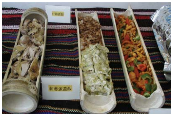
▲原住民美食善用天然器物和原始食材。

公)下廚，暨溫柔又可精進廚藝，一舉兩得！建議喜好山野活動者，從登山糧食中不斷學習與精進，累積經驗與知識，在山上才會吃得好、吃得飽、吃得開心。山野活動不乏美食主義者，且先讓自己學習當個大廚開始吧！