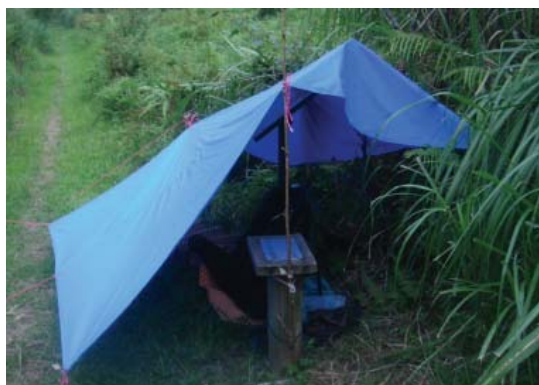
▲住宿和緊急避難是山野知識技能的進階。

當你爬過小山,想向中級山與高山過度與進階時,環繞著和住有關的問題,便是重要考驗。你裝備攜帶得足夠嗎?你懂得如何選擇一個好營地嗎?你會營造一個安全而舒適的居住環境吧?其中,避風雨、有水有火,是重要的課題。在此,期許各位愛好大自然的朋友們,都能努力充實和登山居住有關的知識技能,才能真的快快樂樂登山,平平安安回家!