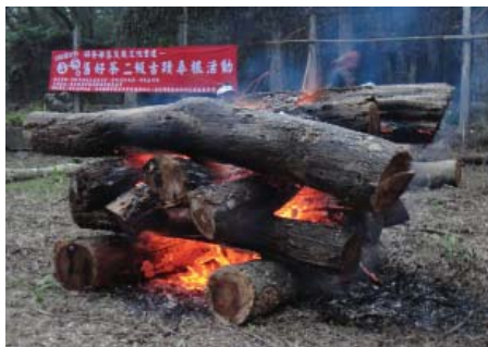
▲材火是原住民山野文化最自然的一環。

如果你在山上必須要生火，那要怎麼生火呢？眾所皆知，燃燒是劇烈的氧化反應，須有可燃物與助燃物，並達到燃點。通常，由火源（作好防潮的打火機最適當）引燃易燃物（簡