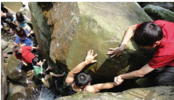
▲山野活動是建立團隊最自然的互動場。