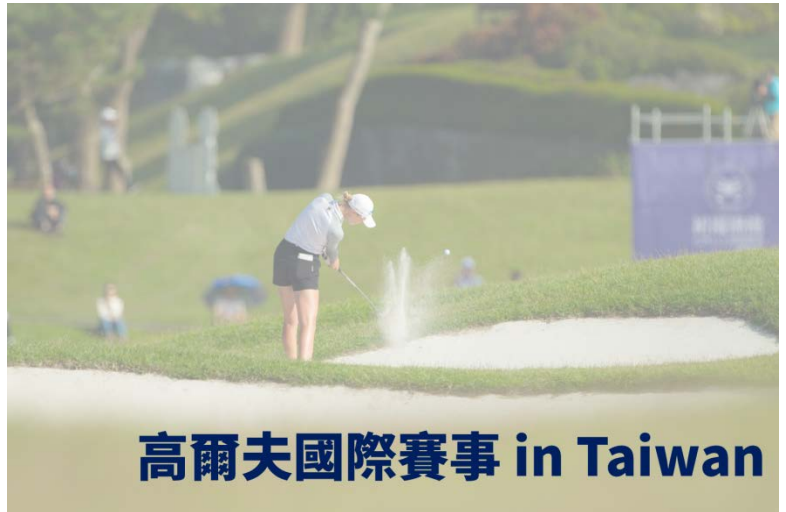
高爾夫國際賽事 in Taiwan