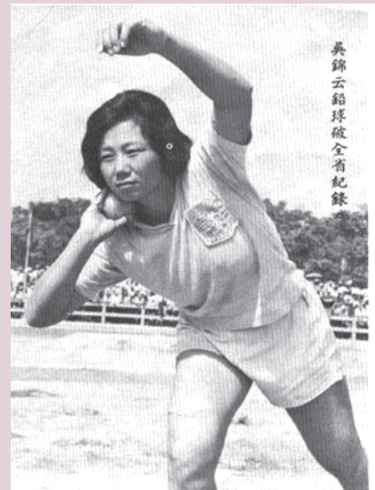
圖4 1961年鉛球打破全國紀錄