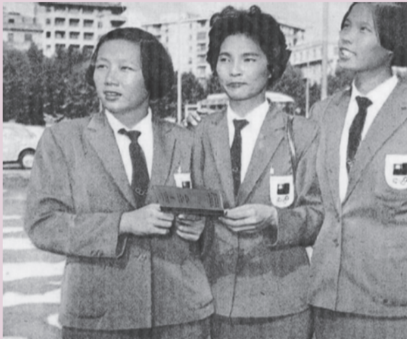
圖3 1960年參加羅馬奧運