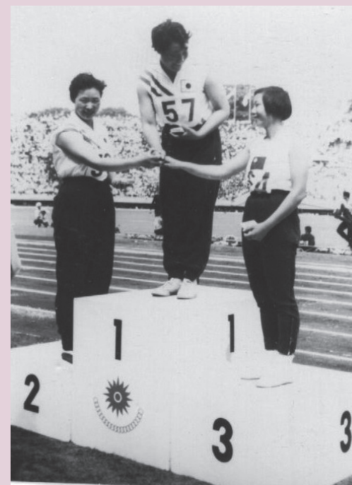
圖2 1958年亞運鉛球銅牌全國賽現身手贏得「三鐵皇后」嘉譽