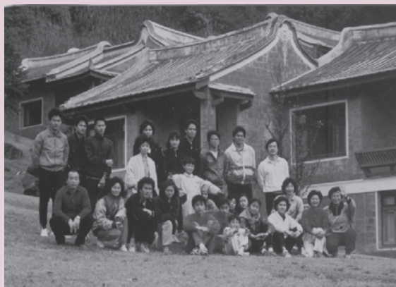
圖8 1986年南園移地訓練