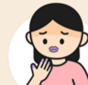
皮膚 / 唇 / 指甲發青