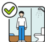
一人一室 獨立衛浴