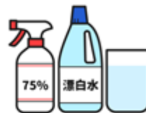
酒精 / 稀釋漂白水 清潔物品