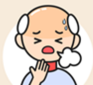
喘 / 呼吸困難