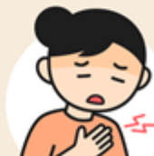
持續胸痛 / 胸悶