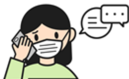
聯絡有症狀前3日的 密切接觸者