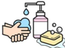
酒精 / 肥皂 清潔手部