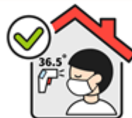
告知接觸者自我隔離 & 健康監測