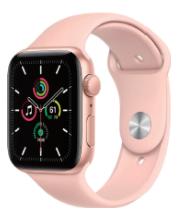
二獎 Apple watch SE/2名