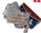
五獎 夯運動防疫包/12名