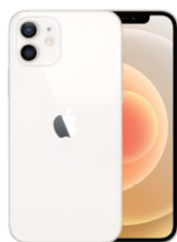
特獎 iPhone 12/1名