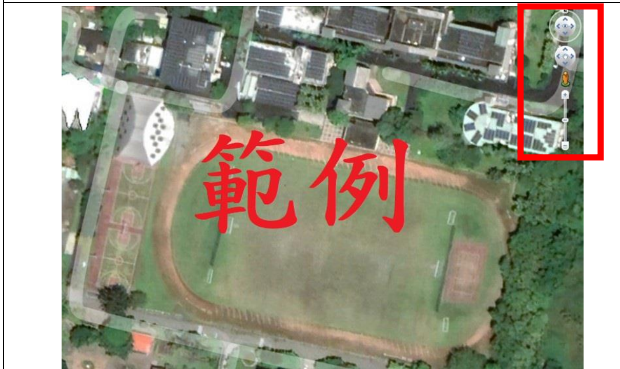
圖 2、空拍圖（請使用 Google Earth Pro，並於右上角附上球場座向標示）