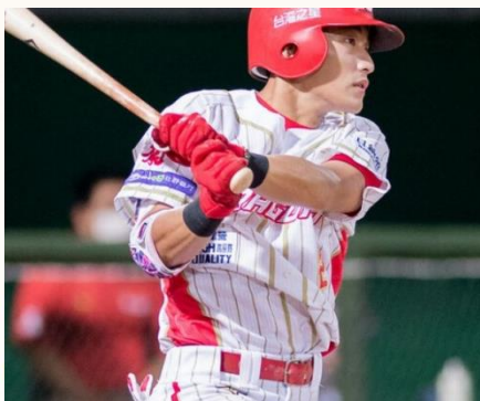
圖 1：Graffo 參與第六期台灣運動創新加速器計畫期間，與職棒味全龍隊合作驗證

近年來運動員身心的話題也廣為大家討論，以往都只專注於場上的競技表現，而忽略了運動員其實心理發展也是一大重要課題，過往較為專業的心理測驗項目，都需要至特定單位或是接受專業人士的檢測，如今只要應用像是 Graffos 這樣方便的系統，就能讓一般人甚至是運動員都可以更加看待心理層面問題，只需利用簡單的 3C 產品，不用甚麼特別貴重儀器，後端分析也可以透過線上的運算執行相關數據，讓訓練更多元、更有趣，也可以促進身心發展。