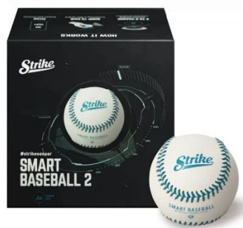
圖 1：Jingletek 智慧棒球

想打棒球卻又害怕遭到太多運動傷害嗎，但帶著護具又怕動作卡卡不能發揮自己的真正實力？臺灣運動創新加速器第 8 期的團隊 Hong Yen Sport 幫你解決困擾，由棒球資歷超過 20 年的前選手親自設計研發，打造磐護機能衣 PROTECH，以其專利的材質和技術，成為全球首款棒壘防護機能衣，讓使用者在從事棒球運動時，不僅能受到完備的防護，原先的運動動作也不會受限制，能更安心運動且有型！