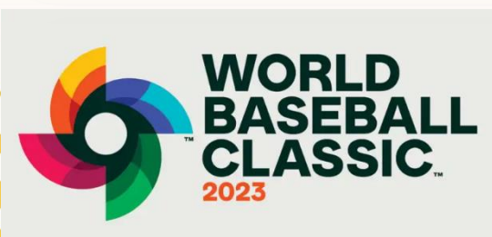
圖 1：世界棒球經典賽活動識別

短期比賽, 考驗著各處徵招而來的球員、教練, 能否快速融合並進入狀況, 面對投打跑守各環節, 如何降低瑕疵與失誤, 並發揮應有水準, 相信是教練與球員首要功課, 更意味著心理素質與抗壓能力, 能否複製 2013 經典賽成功經驗, 在大軍壓境下拿到 8 強門票, 是所有球迷、國民的期待。