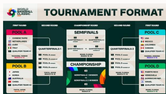
圖 2：各組賽事表