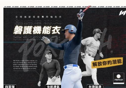
圖 3：Hong Yen Sport 輕量防護機能衣