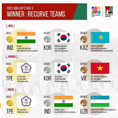
圖 1：2022 年亞洲盃第三站，反曲弓團隊奪牌名次。

射箭賽事，是臺灣少數全球運動中，擁有各項賽事奪牌實力的運動，在臺灣能見度也逐漸打開。今年亞洲巡迴賽首戰在臺灣桃園舉辦，除了有奪牌壓力外，也為接下來世界大賽做好暖身，期盼臺灣選手射出佳績，更歡迎民眾於賽事期間為臺灣選手加油。