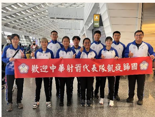
圖 2：2022 亞洲巡迴賽，臺灣代表隊合照。