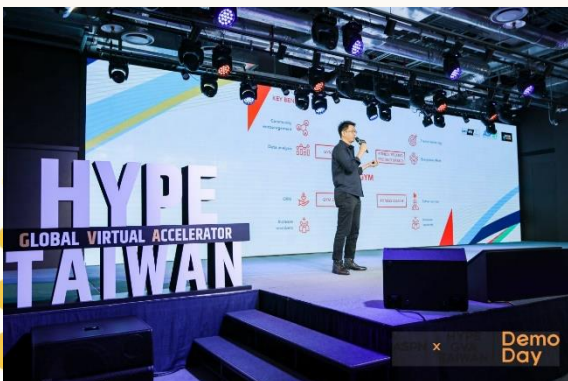
圖 1：IoGYM 參與第八期台灣運動創新加速器計畫 Demo Day。

IoGYM 於 2022 年加入臺灣運動創新加速器 HYPE GVA Taiwan 第 8 期計畫，在培訓計畫期間也不斷獲得各業師的指導和市場策略的規劃，IoGYM 的表現優異，也屢屢和不同部會合作計畫，持續在健身這個領域茁壯發展。