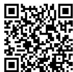
特定國家人士 來臺申請停留 簽證手續