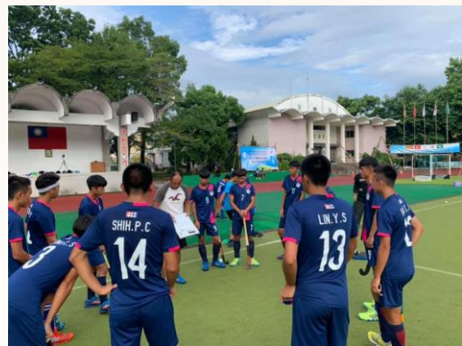
圖 2：2019 賽事現場一角，男子組賽前訓練。