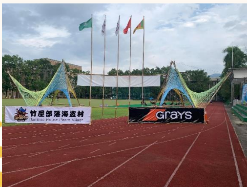
圖 1：2019 賽事現場一角。

甫落幕的 2023 男子青年亞洲盃曲棍球錦標賽，男子組最終以 5 比 4 成績險勝斯里蘭卡，以 2 勝 2 平 1 敗成績坐收，相信後續相關賽事可以繼續洗禮球隊。而無論是青年盃亞洲賽、臺灣國際邀請賽、亞洲盃錦標賽，臺灣球員成績有越來越好的趨勢，相信值得更多民眾關注，也為每場比賽的選手加油。