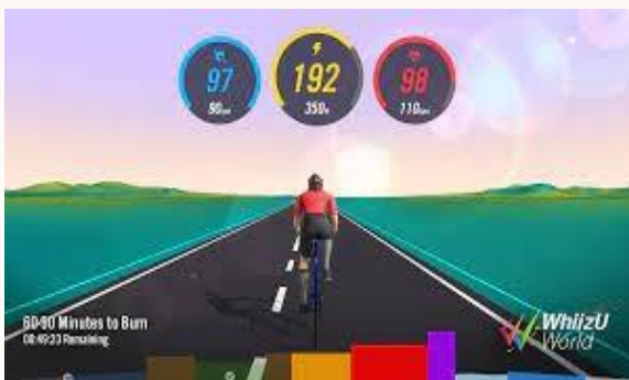
圖 1：WhiizU 介面

臺灣的自由車產業發達，而結合時下最受矚目的虛擬實境技術，讓自由車愛好者可以不受環境天氣限制，鍛鍊自己並盡情發揮實力，而自 2021 年起亞洲第一個電競自由車國際賽事也應運而生，也讓大家看到臺灣運動創新的實力。