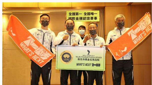
圖 2：新北市長侯友宜與中華民國田徑協會理事長葉政彥及秘書長王景成，共同宣布 2023 新北市萬金石馬拉松為全國第一且是唯一的「金標賽事」。