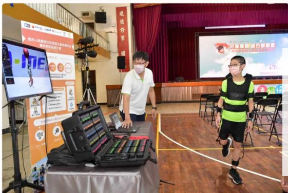
圖 1：晶翔機電透過穿戴裝置及 AI 技術分析，提升兒童運動品質

晶翔於 2018 年加入 HYPE GVA Taiwan 初創第一期的培訓計畫，優異的表現在計畫中也媒合許多業師和投資人，近來參與了許多由 HYPE GVA Taiwan 所舉辦之展攤和其他國際交流活動。過目前正積極投入 AI 人工智慧的開發，並結合 AR、VR 及 MR 的體感互動領域 ( Interactive Motion Sensing )，以開創更多滿足社會需求的智慧應用與商機。