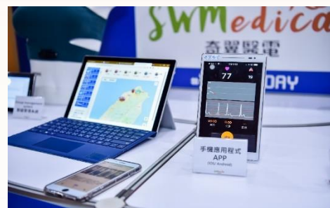
圖 2：奇翼醫電參與 HYPE GVA Taiwan 臺灣運動科技創新加速器第二期計畫的 Demo Day