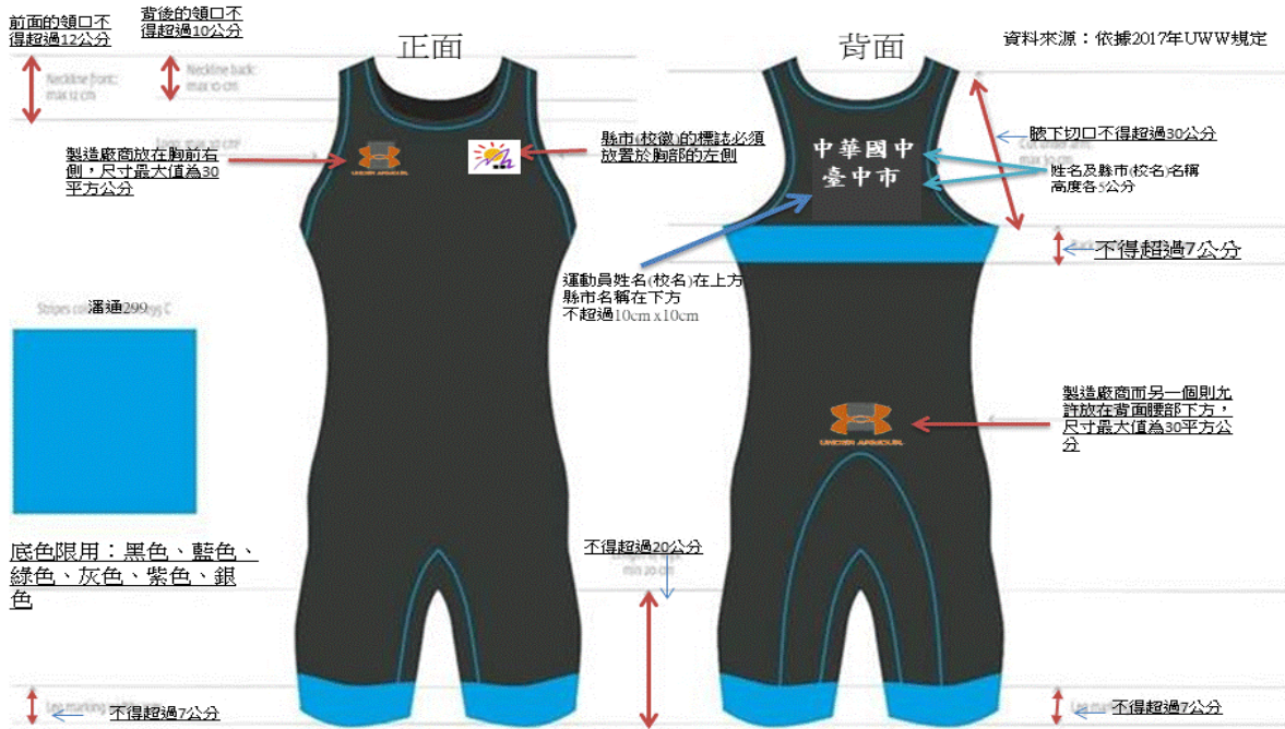
角力服腿的長度必須停止於膝蓋上方，並且不得短於膝上15公分