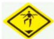
水深危險 BEWARE OF DEEP WATER