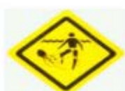
小心水母 BEWARE OF STINGERS