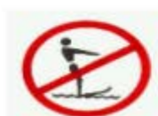
禁止潛水 WATER SKIING PROHIBITED