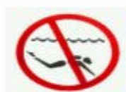
禁止水肺潛水 SCUBA DIVING PROHIBITED