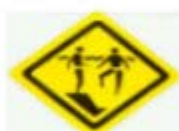
小心突降陡坡 BEWARE SUDDEN DROP-OFF