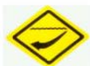
小心強勁暗流、激流 BEWARE STRONG UNDERCURRENT OR RIP