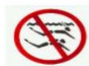
禁止潛水 SKIN DIVING(SNORKLING) & SCUBA DIVING PROHIBITED