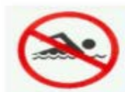
禁止游泳 SWIMMING PROHIBITED