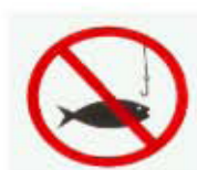
禁止釣魚 FISHING PROHIBITED