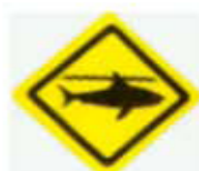
小心鯊魚 BEWARE OF SHARKS