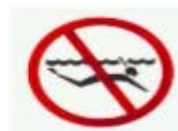
禁止浮潛 SKIN DIVING (SNORKLING) PROHIBITED