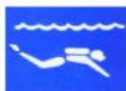
水肺潛水 SCUBA DIVING