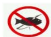
禁止射魚 SPEAR FISHING PROHIBITED