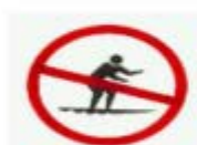
禁止衝浪 SURFBOARD RIDING PROHIBITED