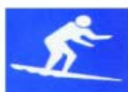
衝浪 SURFBOARD RIDING