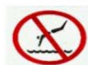
禁止跳水 DIVING PROHIBITED