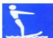
潛水 WATER SKIING