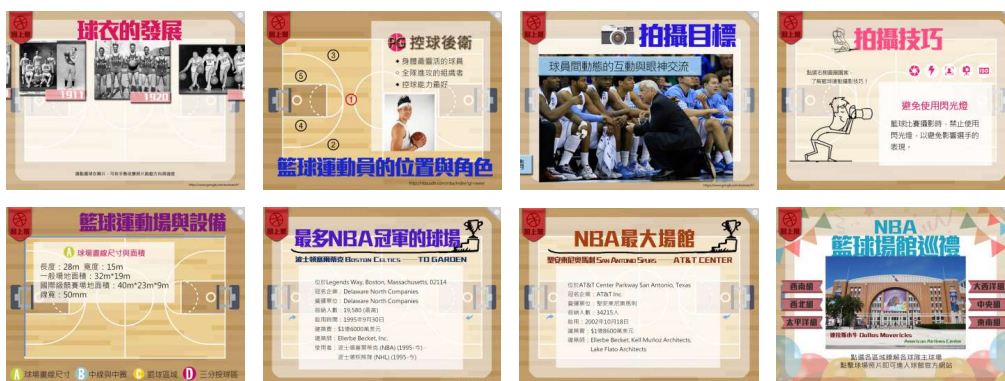
圖5-2 籃球維納斯的设计畫面截圖