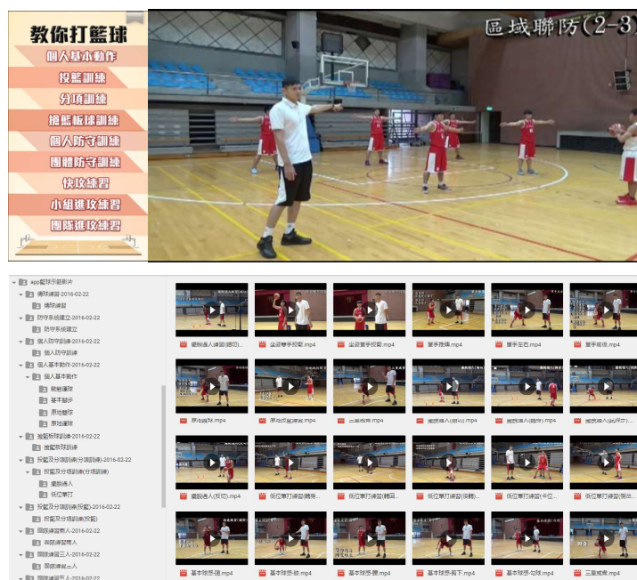
圖6 「教你打籃球」的設計畫面截圖

(1) 五人團隊23451，(2) 破區域131練習，(3) 破盯人41，(4) 破盯人42，(5) 破盯人43，(6) 破盯人牛角。