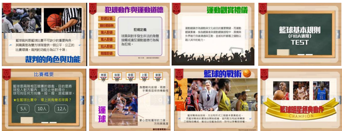
圖3-2 籃球大法官的設計畫面截圖