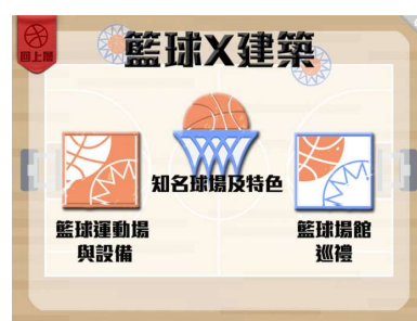
圖5-1 籃球維納斯的设计畫面截圖