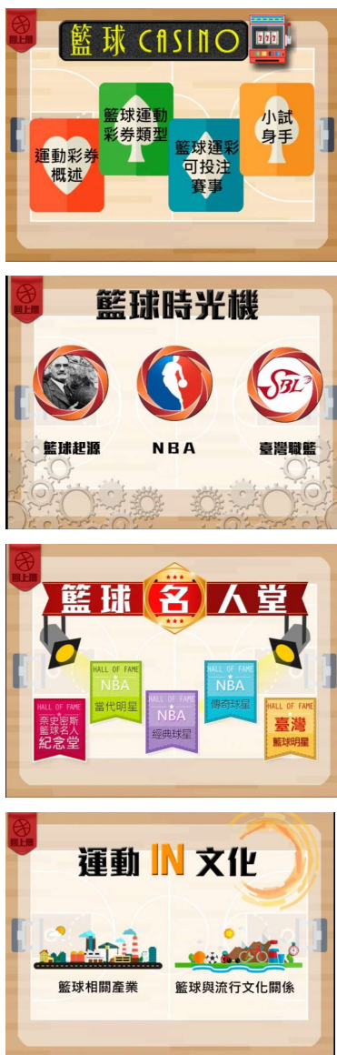
圖4-1 籃球大視界的设计畫面截圖