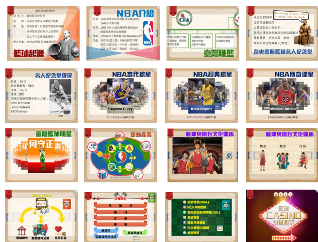
圖4-2 籃球大視界的设计畫面截圖