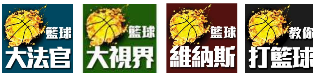
圖2 「師大瘋籃球APP」的四個主題

「師大瘋籃球」是為籃球教學APP，係依運動觀賞素養課程之數位教學輔助系統教材所研發。教育目標包含籃球技術與戰術、籃球基本規則與籃球素養、籃球發展與知識、籃球流行文化與美學等四大目標。內有四個主題，分別是「籃球大法官」、「籃球大視界」、「籃球維納斯」、「教你打籃球」四面向。